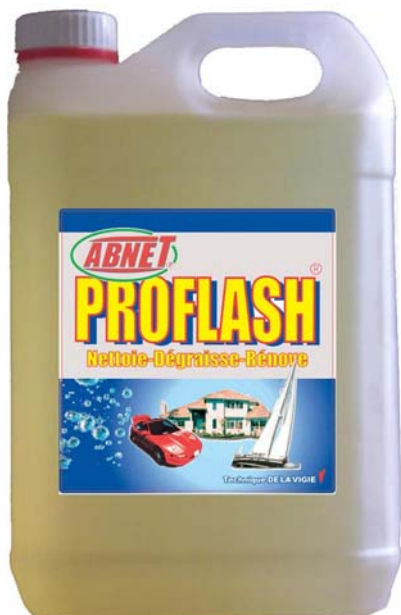
1 Etiquette Recto